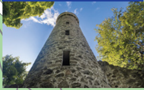
Der Aussichtsturm Hamelka