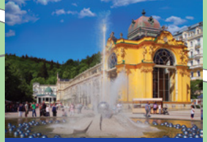
Die singende Fontäne