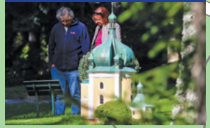
Der Miniaturpark Boheminium