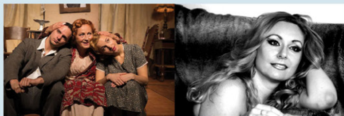
Skleněný zvěřinec, Divadelní agentura Harlekyn Praha

Individuální prohlídky divadelní galerie v úterý 7.9. a 21.9. od 14.00 do 16.00, vstup zdarma