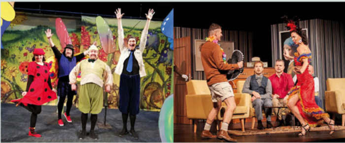
Velká dobrodružství malého brouka, Divadlo za 2 Praha