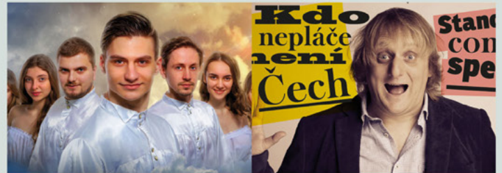
Rytmus v srdci, taneční soubor Merlin

Prohlídka divadla s průvodcem v úterý 5.10. od 14.00 v češtině, od 15.00 v němčině. Individuální prohlídky divadelní galerie v úterý 19.10. a 26.10. od 14.00 do 16.00, vstup zdarma.