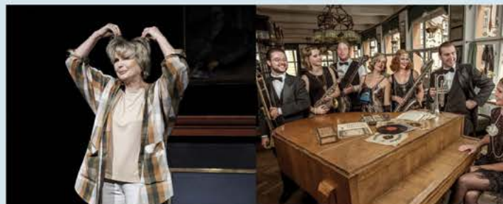
Můj báječný rozvod, Divadlo Jan Balzer Praha Večer v rytmu nejen swingu, Prague Rhythm Kings

Jazz – Blues – Swing Hudba 20. a 30. let zazní v originální interpretaci hot – jazzového orchestru Prague Rhythm Kings , jehož členům se také říká „pražští králové (a královny) rytmu“. Nenechte si ujít večer plný krásné hudby. Orchester hraje ve složení: trubka, klarinet, saxofon, trombon, baryton saxofon, klavír, banjo, kytara a zpěv. Program je složený z českých a amerických skladeb.