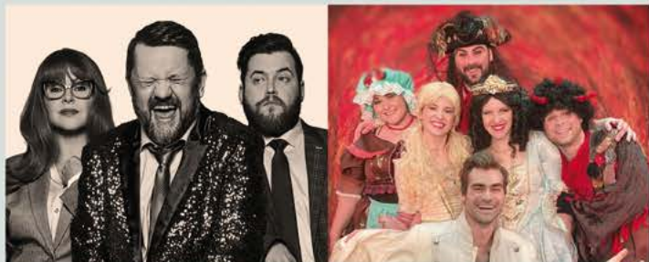
Bavič, Divadlo Bez zábradlí