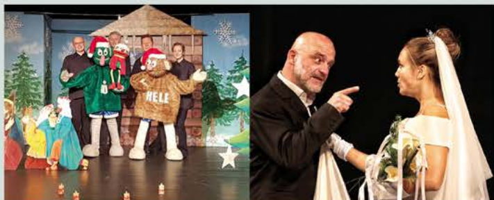
Vánoční čas, loutková revue, skupina Loudadlo

Školní představení, doprodej volných míst pro veřejnost.