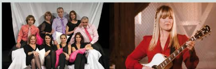
Do ložnice vstupujte jednotlivě, Divadlo Háta Praha

Kokoloko Praha s.r.o. Komediatně edukativní divadelní představení o literárních titulech a jejich autorech. Divadelní představení pro ZŠ a SŠ, doprodej volných míst v den akce přímo v divadle.